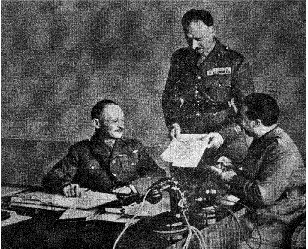
ژنرال ویگان در دفتر کار خود هنگام صدور دستورهای لازم